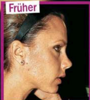
Früher Pickel & Pusteln – wie passt das zu einer Perfektionistin? Aber tatsächlich kämpft auch Victoria Beckham täglich mit fettiger Haut. Einmal zu viel oder falsches Make-up und Poshs Gesicht ist übersät von Mini-Irritationen